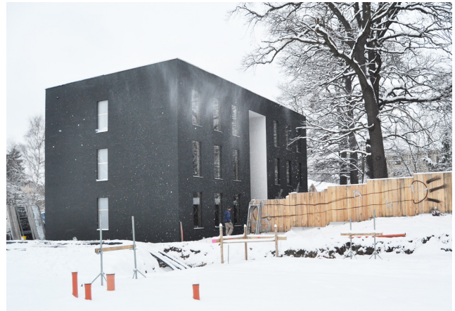
Eingangsseite nach Abschluss der Putzarbeiten

Die Werkstoffeigenschaften konnten bereits während der Entwicklungsphase überzeugen und motivieren alle Beteiligten, die Entwicklung des Produkts zur Marktreife fortzuführen. Das Instrument des experimentellen Bauens - des konkreten Projekts - als Entwicklungsmotor soll durch neue Bauaufgaben weiterhin erfolgreich eingesetzt werden.