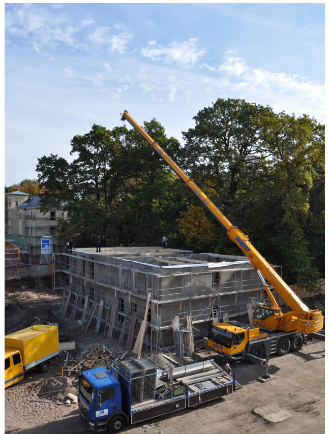
Montage des mittleren Geschosses