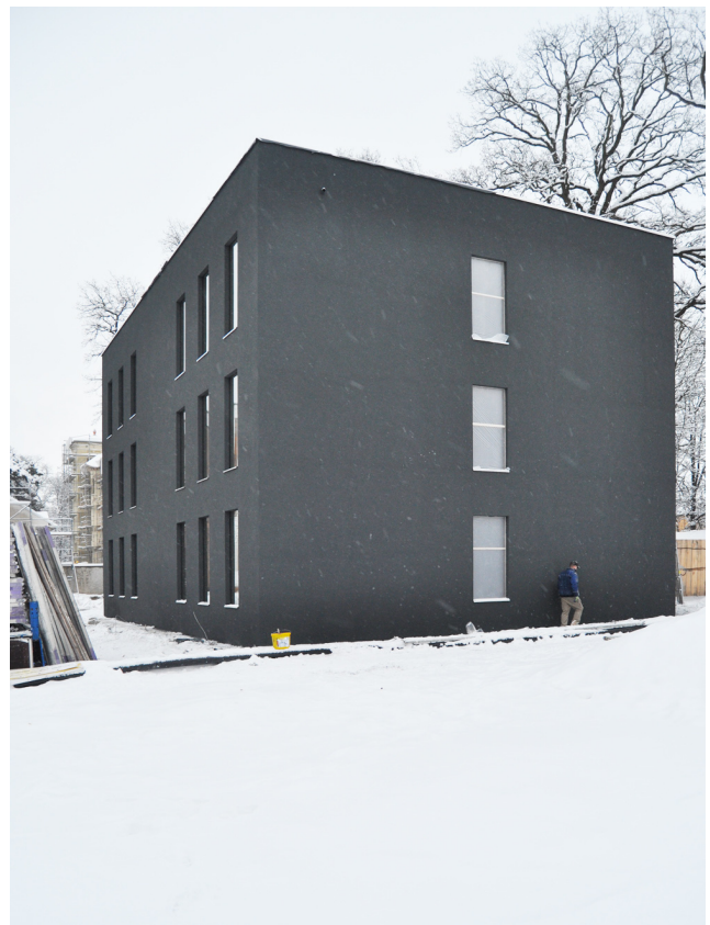
Rückseite nach Abschluss der Putzarbeiten