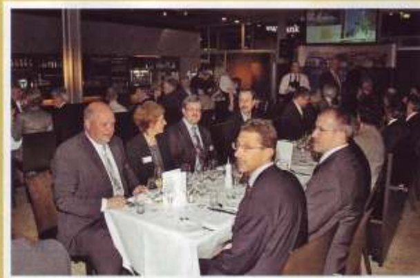
Hoch oben über Stuttgart: Auf der 4. Etage im Restaurant „Cube“ im Kunstmuseum Stuttgart fand wiederum das Golden-Cube-Event statt.